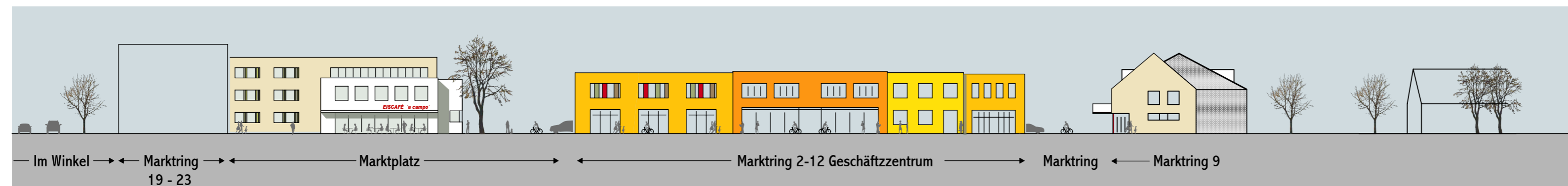
Ansicht Marktring 25, 2 - 12 und 9 _ Fassadengestaltung ohne Aufstockung