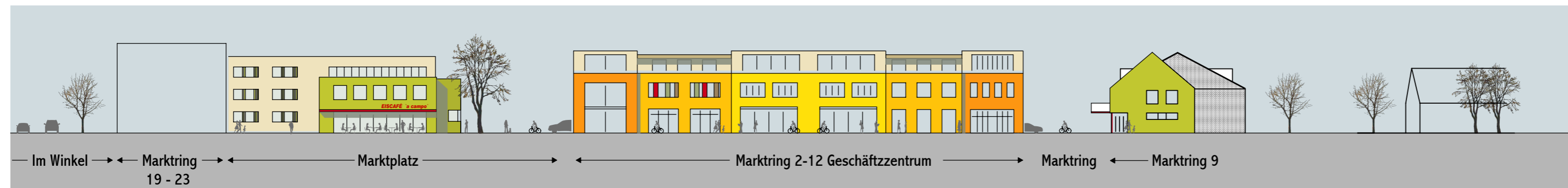
Ansicht Marktring 25, 2 - 12 und 9 _ städtebauliche Maßnahmen und Fassadengestaltung