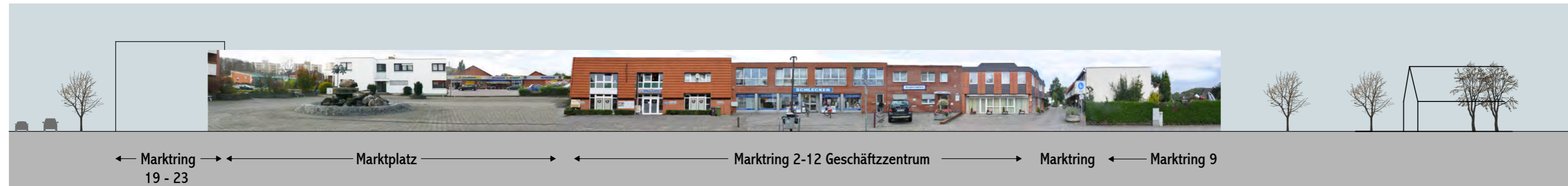
Ansicht Marktring 25, 2 - 12 und 9 _ Bestand